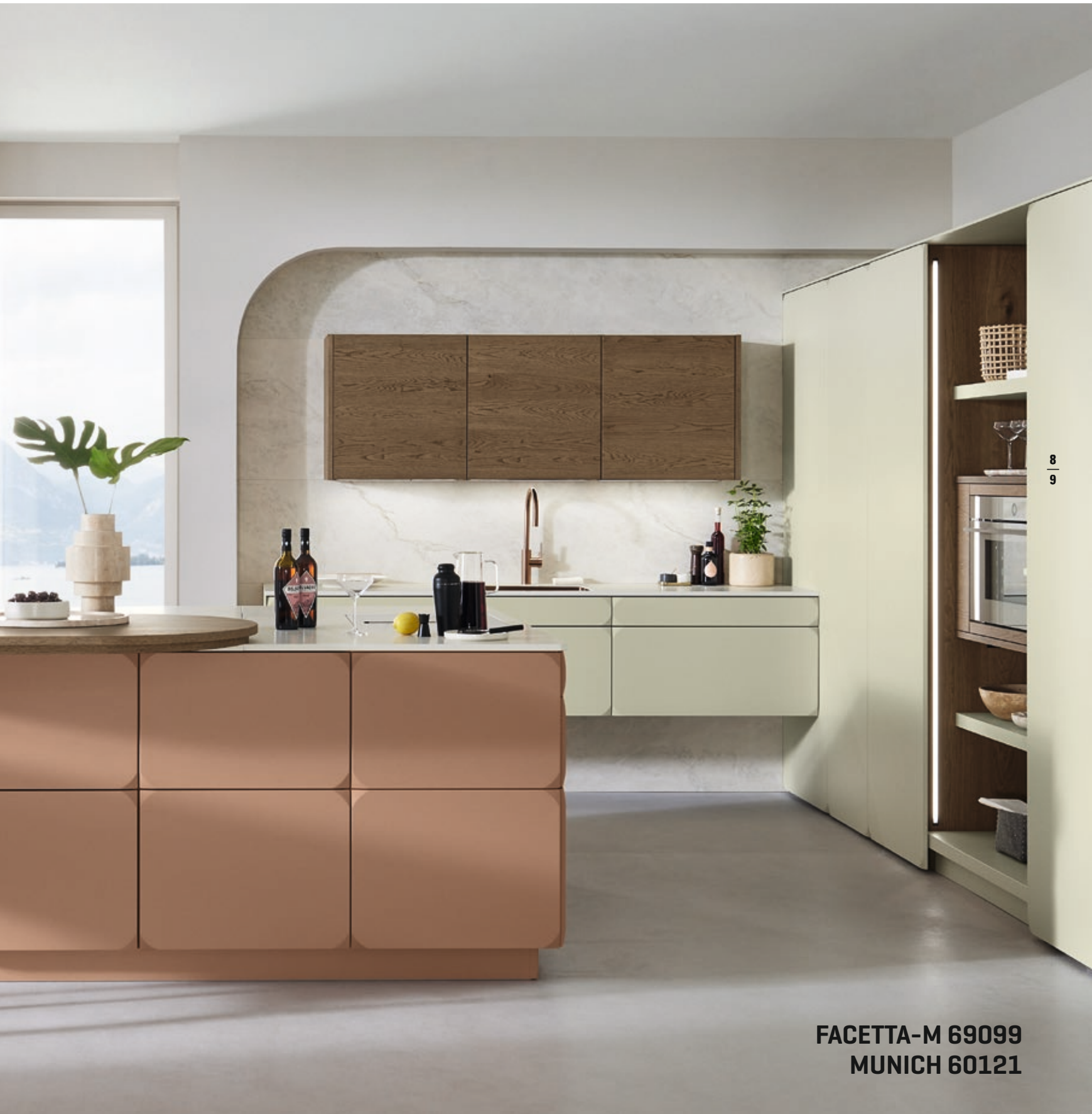
FACETTA-M 69099 MUNICH 60121