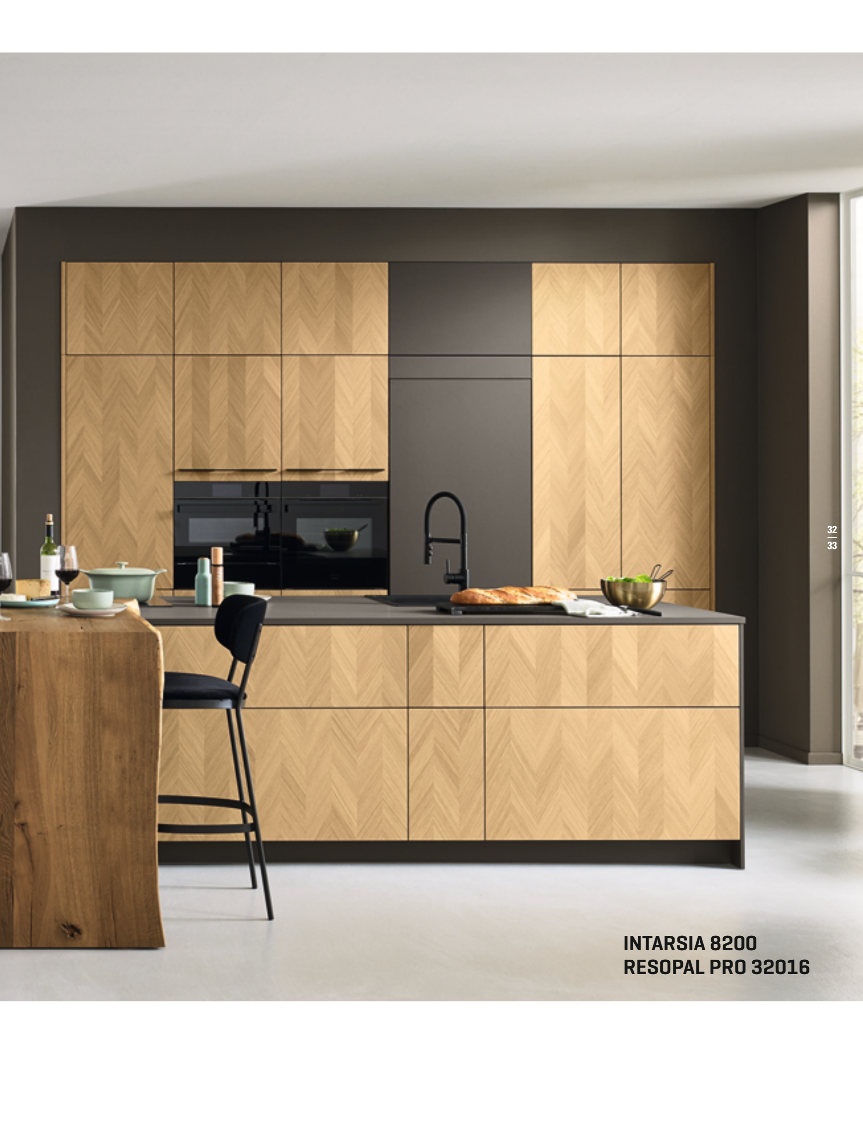
INTARSIA 8200 RESOPAL PRO 32016