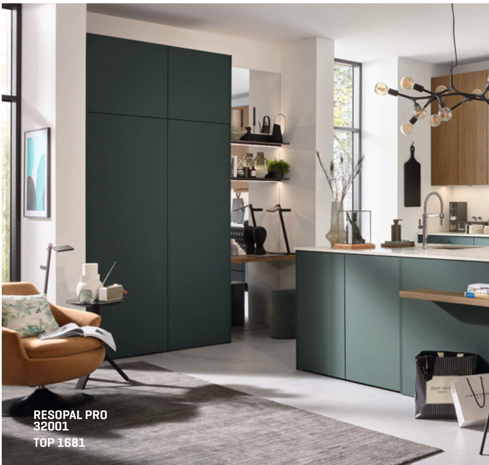
RESOPAL PRO 32001 TOP 1681

Een qua esthetiek en functionaliteit overtuigende zet is de volledige benutting van de aanwezige ruimte tot aan het plafond. Ons raster-systeem maakt iedere individuele wens- en werkhoogte mogelijk – bij onder-, boven- en hoge kasten. Alleen bij de bovenkasten kan al uit tien verschillende hoogtes worden gekozen. Wie voor een van de extra hoge kastmodellen kiest, krijgt hierdoor ook enorm veel extra ruimte. Het kort aanraken van de elegante, greeploze fronten is al voldoende om de hoge deurvleugels vrijwel geruisloos te laten openen.