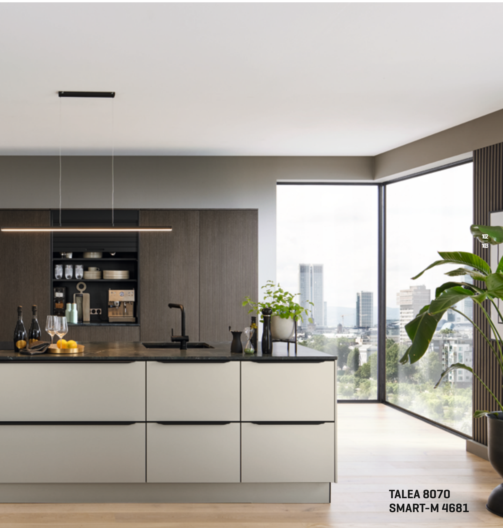
TALEA 8070 SMART-M 4681