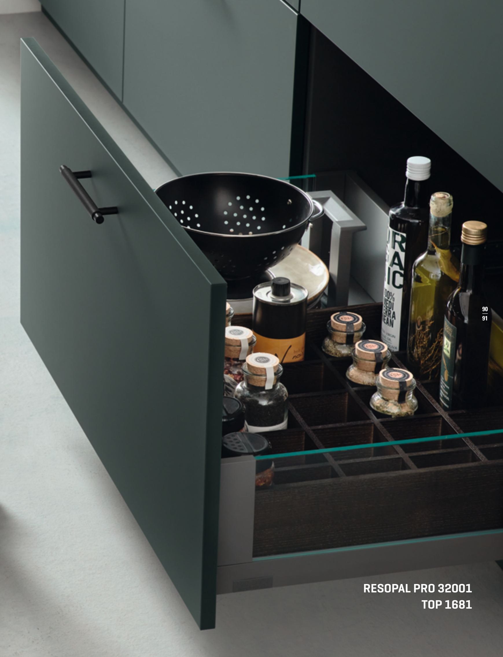
RESOPAL PRO 32001 TOP 1681