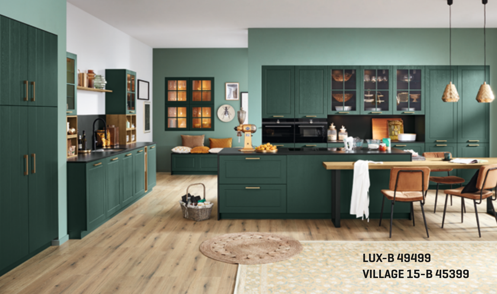
LUX-B 49499 VILLAGE 15-B 45399