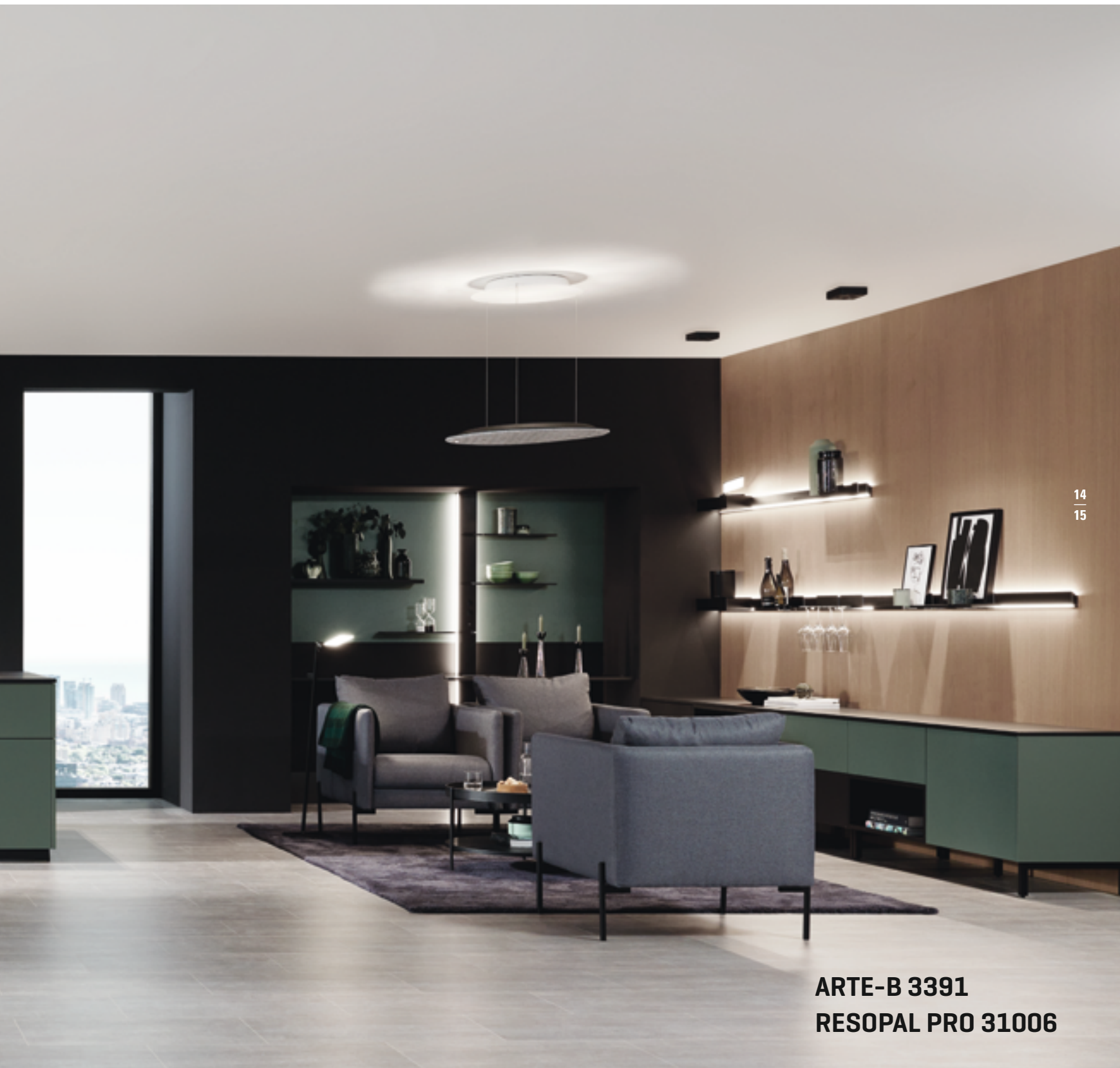
ARTE-B 3391 RESOPAL PRO 31006