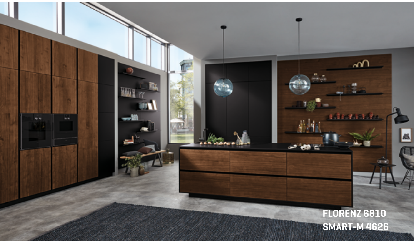
FLORENZ 6810 SMART-M 4626

Selected material quality combined with artistry: as a showpiece, the island unveils craftsmanship of outstanding beauty. Without any ifs and buts, purist design forgoing handles places every confidence on the impact of shining walnut and matt black as combination partners. Built-in unit and shelves consistently continue the horizontal lines. Gloss and transparency, grain and matt glass – the classy materials are the key players in this interior. A quintessence, far removed from fashion trends.